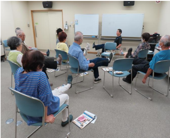
写真③ フレイル予防講座