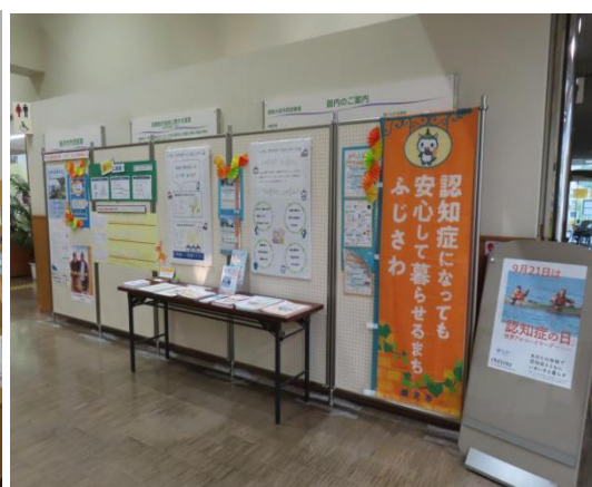
写真② エントランス展示