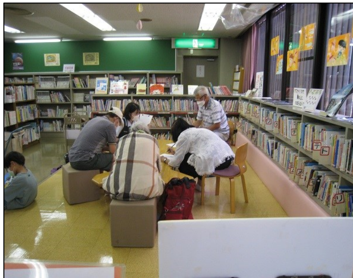
いきいき脳トレクイズに挑戦中