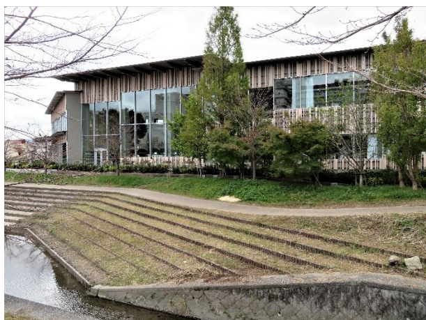
東南面から見た外観