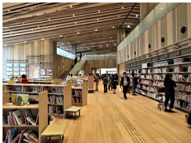
入口からカウンターへ