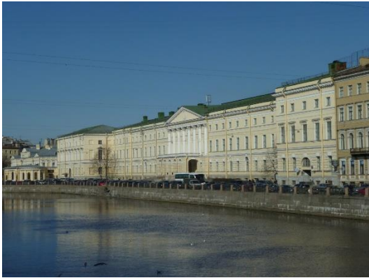
写真1 フォンタンカ館（ロシア国立図書館 連邦資料保存センター）

連邦資料保存センターは、紙資料の保存修復の分野において主要な業績としてリーフキャスティングの発明をしたことで知られている。同センターの成り立ちは、1934年衛生関係の測定及び修復活動を行う部門を設置したことに遡り、1948年設立された国立図書館の研究所が、1950年衛生管理・修復を取り扱う特別な施設として統合された機関である。