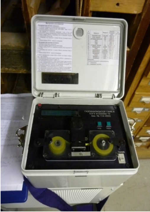
写真2 FDCC で用いられる VOC 測定器 : Universal Gas Analyzer GANK-4

カセットテープ状の検知シートが内蔵されたケミカルカセット（取り外し可能）を挿入して測定する場合もあった。許容限界濃度値（PDK）を越える場合は、シグナルが作動し、測定者に知らせる仕組みになっていた。物質の測定範囲は、0.001~25.0(mg/m 3 またはvol%)であった。