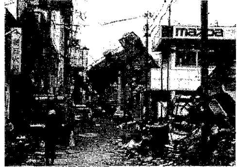
▶倒壊したビルと焼け跡▶