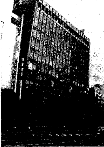
◀中間階が崩壊した高層ビル