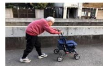
監督・撮影・語り ひとり娘 信友直子