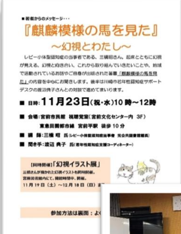
②「麒麟模様の馬を見た」